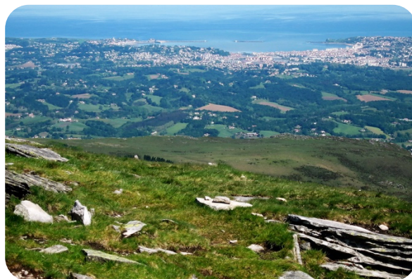
Sommet de La Rhune

Merci de prévenir la résidence en cas d'arrivée tardive.